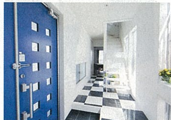
玄関ホールは、ブルーの玄関扉とモノトーンの組み合わせでアメリカンな雰囲気に