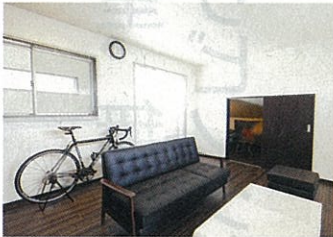
2階の洋室には、デッドスペースを利用してウォークインクローゼットを設けている