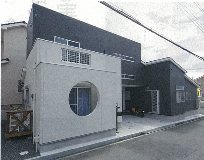
建物の中央に玄関を設け、左右に居室をつくることで、横長の敷地を有効活用。バルコニーの壁を丸くくり貫いたアクセントは、丸窓を設けるよりもコストダウンが図れると当社が提案