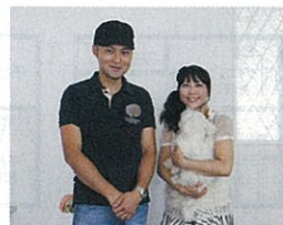
「コストを抑えて希望通りの家が完成しました」とさん