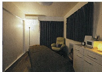
セラピストであるお母様のセラピールーム。白い部屋だからこそライティングが活きる