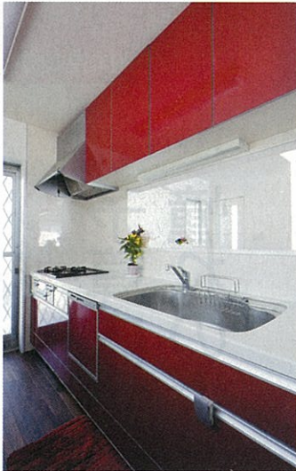
キッチンは鮮やかながら深みのある赤をセレクトすることでオシャレ度がグンと高まった