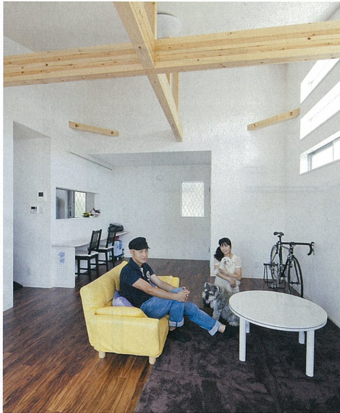
天井を高くして梁を見せ、木目調の床というリビングはリラックスできる空間。「以前の家が日当たりが悪く暗かったので、明るい家にしたかった」というさんは、白い室内を希望した