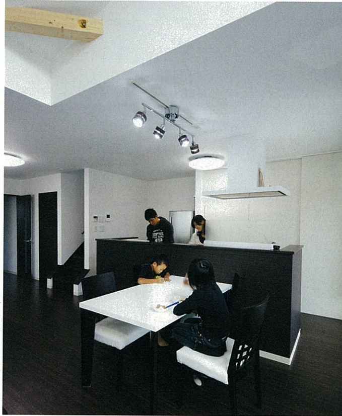
「白い壁に木目が調和する家」という希望に、同社は手入れのしやすい木目柄のフロアタイルを提案。キッチンの位置を途中で変更して回遊できるようにするなど、柔軟な対応も魅力だ