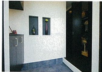
リビングのソファにコートなどを置かなくて済むようにと、玄関近くに納戸を配置