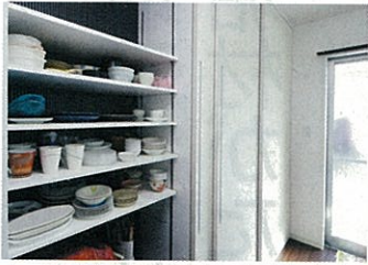
キッチン背面は一面の収納。奥の壁にもクロスを貼って、扉を開けた時の印象にも配慮