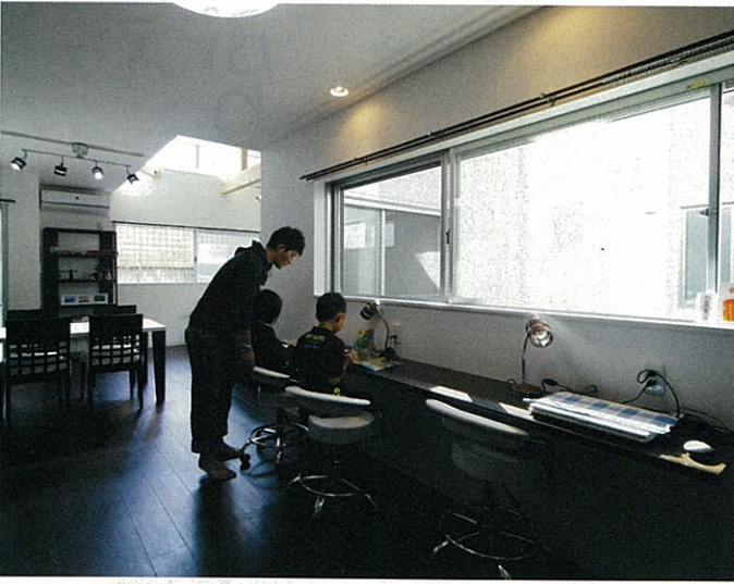
キッチンから見える位置に、お子さんが勉強したり本を読んだりできるカウンターを配置。奥のリビングは、天井を逆勾配にして、南からの光を取り入れられるように工夫されている