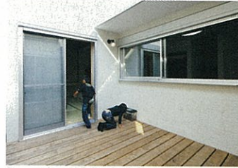
ウッドデッキは和室からもリビングからも出入りできる。第2のリビングとして大活躍