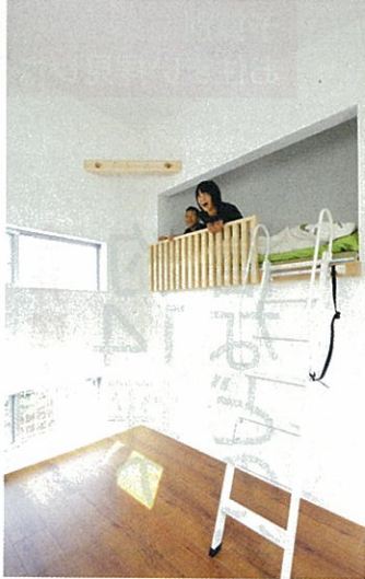
子ども部屋には壁をくり貫いてベッドになる空間を創出。隣の部屋は下部がベッドに