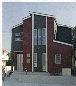
CGでシミュレーションして決めた外観は、赤×黒が印象的