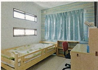
同社は部屋ごとにクロスを変えることも提案。子ども部屋のクロスはお子さん自身が選んだ